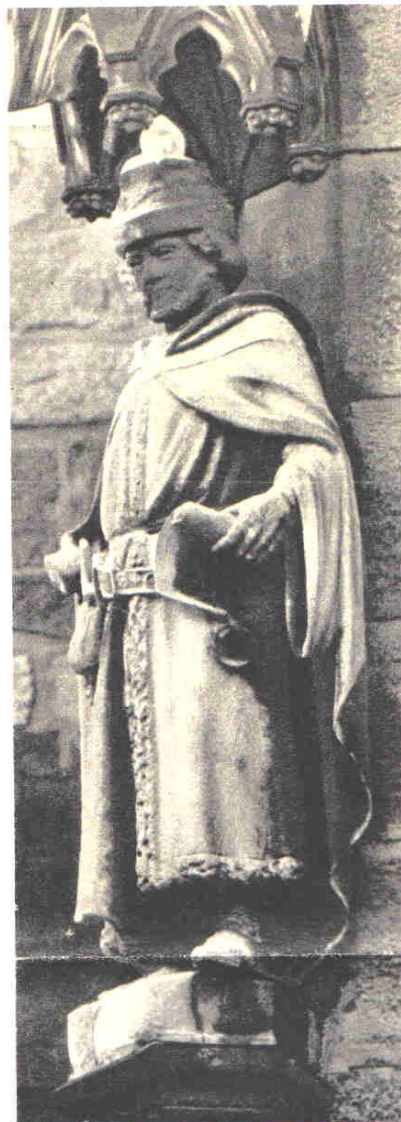
Beeld van Gerhard Chorus, aan de gevel van het Raadhuis in Aken