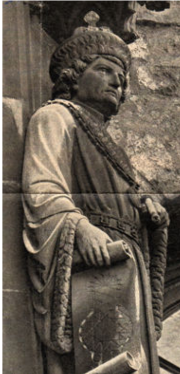
Beeld van Gerhard Chorus op de traverse van het octagoon van de Dom in Aken